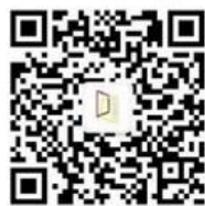
同济大学德国研究中心

编辑出版：《德国研究》编辑部 责任编辑：朱宇方 地址：200092 上海市同济大学 电话：65980918, 65983997 E-mail: dgyj@tongji.edu.cn